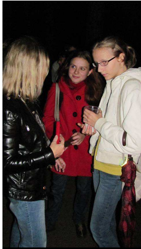
Neapsieita ir be šokių: