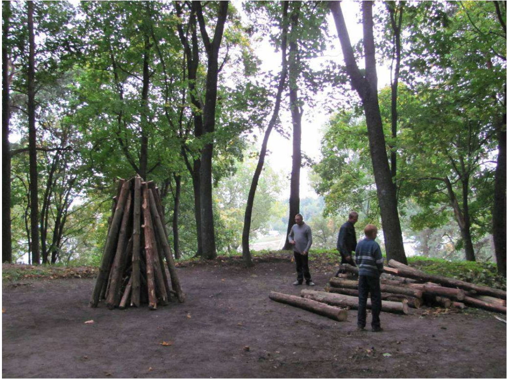
Netrukus pradėjo rinktis ir pirmieji Baltų vienybės šventės dalyviai: